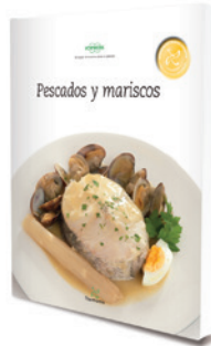
Pescados y mariscos