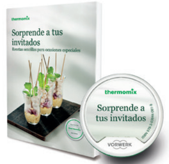
Libro impreso Sorprende a tus Invitados Libro digital Sorprende a tus Invitados