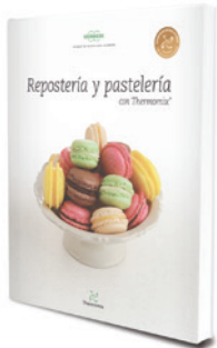
Repostería y pastelería