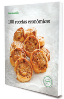
100 recetas económicas *PVP: 25 €