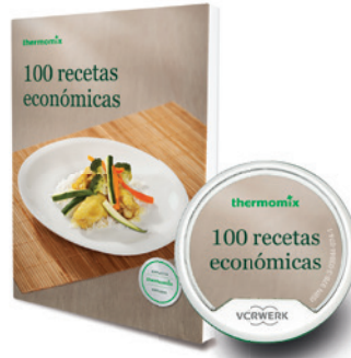
Libro impreso 100 recetas económicas Libro digital 100 recetas económicas