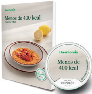
Libro impreso Menos de 400 Kcal Libro digital Menos de 400 Kcal