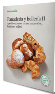
Panadería y bollería Vol.2