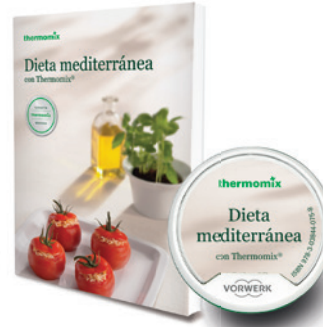
Libro impreso Dieta Mediterránea Libro digital Dieta Mediterránea