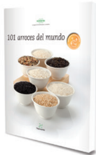
101 Arroces del mundo