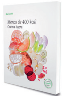
Menos de 400 Kcal. Cocina ligera