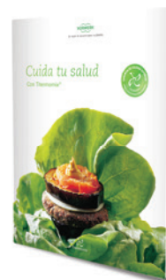
Cuida tu salud