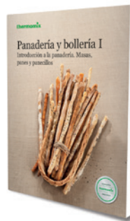
Panadería y bollería Vol.1